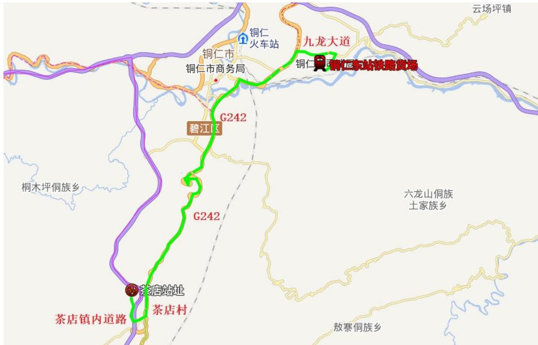
图3.2-4 铜仁东货场至茶店站址运输路线图