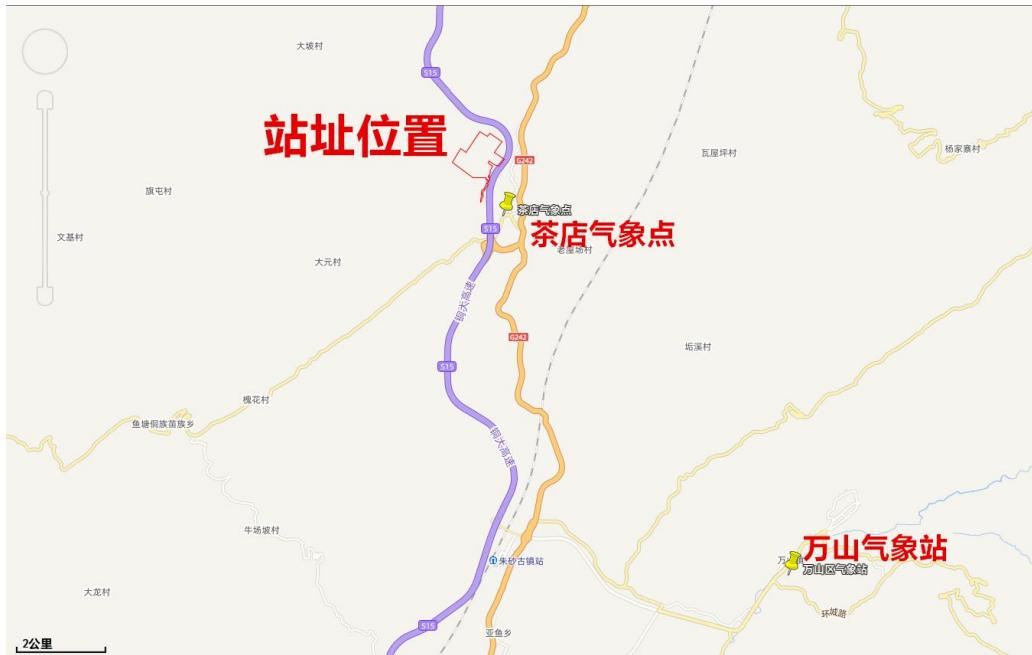
图3.2-2 万山气象站气象特征值表