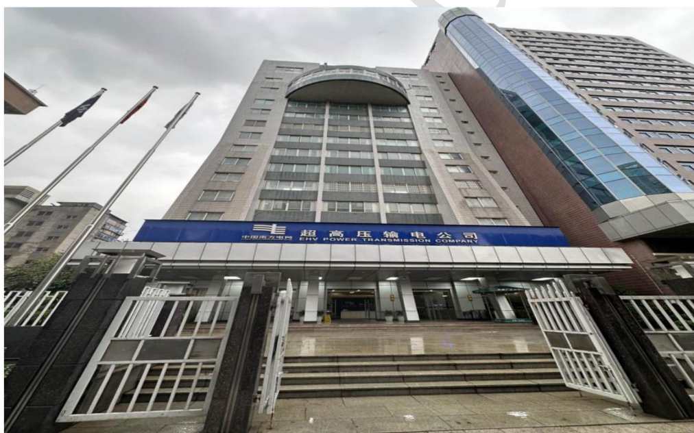
3. 天河区天河路 176 号