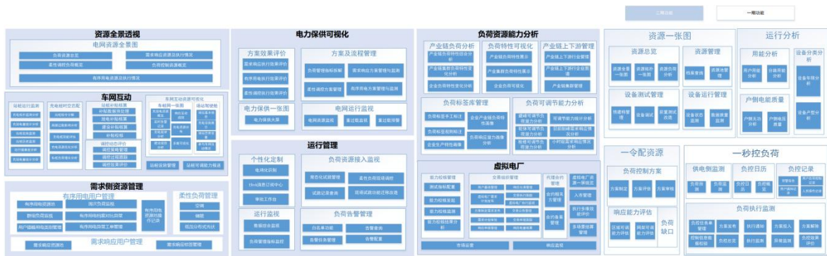
图 4.3-2 功能架构图

新型需求侧管理系统包括资源全景透视、需求侧资源管理、电力保供可视化、运行管理、负荷资源能力分析、车网互动、虚拟电厂 7 个模块，系统功能结构图如下：